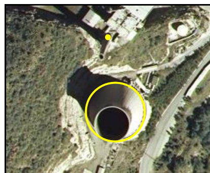
Ejemplos de Chimenea